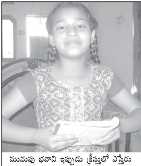
మునుపు భవాని ఇప్పుడు క్రీస్తులో ఎస్తేరు