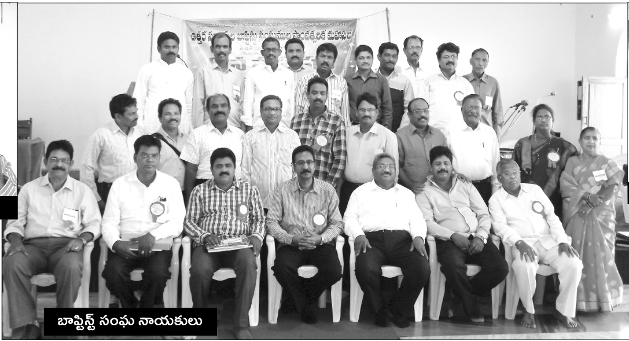
బాప్టిస్ట్ సంఘ నాయకులు