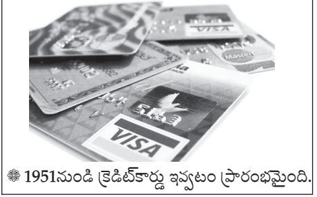
● 1951నుండి క్రెడిట్ కార్డు ఇవ్వటం ప్రారంభమైంది. ● మనిషి తలలో 22 ఎముకలుంటాయి.

● మనం సుమారుగా రోజుకు 5000 పదాలు మాట్లాడతాము. అందులో 80 శాతం మనలో మనమే మాట్లాడుకుంటాం.