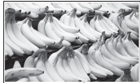
● అరటి పండులో ఉండే ప్రోటీన్ల కన్నా ఓ సాధారణ చాక్లెట్ క్యాండిల్లో ఉండే ప్రోటీన్ల శాతం ఎక్కువ

● టెలిఫోన్ కనిపెట్టిన అల్లెగొండర్ గ్రాహంబెల్ భార్య, తల్లి ఇద్దరూ చెవిటివారే.