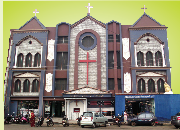
Estd.1948 26-11-2014 తేదీన ప్రారంభించబడిన నూతన నిర్మాణం