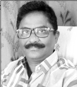
బ్రదర్ వై కనకరాజు (హోలీ బైబిస్టి)