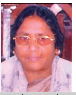
వివేకవతి.జో. అధ్యక్షులు తెలుగు బాప్టిస్ట్ సంఘం నల్లిమర్ల