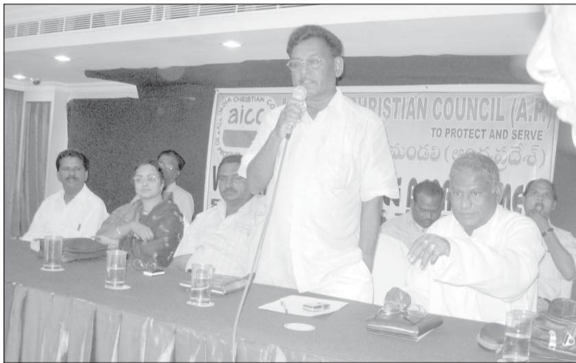
▲ ఎ.ఐ.సి.సి. మీటింగులో క్రైస్తవ నాయకునిగా...