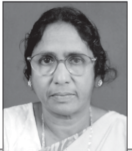
సహిబాదరి వివేకవతి. జో విజయనగరం

స్వరూపము: అక్షయమగు మహిమాన్వరూపి అత్యున్నతాపి. నిత్యజ్యోతియు, దేవత్వమనునవి అదృశ్యలక్షణములు అత్యున్నతాపియగు పరిశుద్ధుడు.