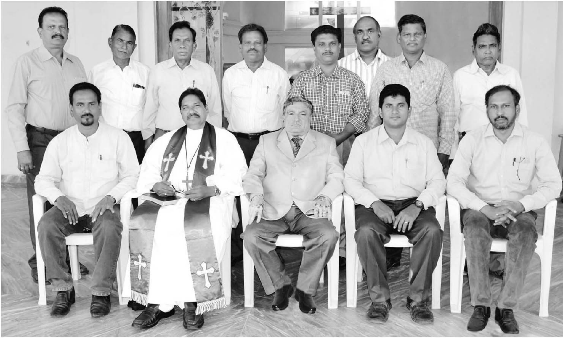
క్రీస్తు శకం 2017