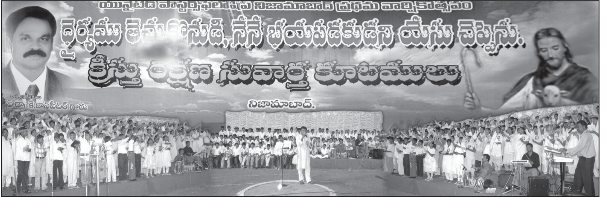
యునైటెడ్ ఫాస్టర్స్ ఫెలోషిప్, విశాఖపట్నం ఆధ్వర్యంలో నిజామాబాద్లో 2006 అక్టోబరు 3,4,5 తేదీలలో వర్షాలు, ఘర్షణల మధ్య సువార్త కూటములు అద్భుతంగా జరుగుతున్న దృశ్యం.