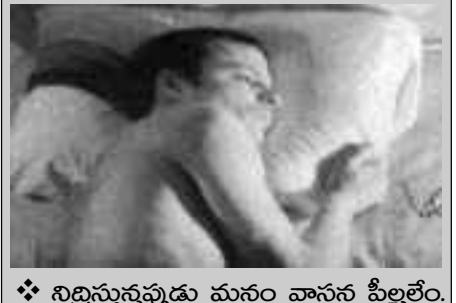
❖ నిద్రిస్తున్నప్పుడు మనం వాసన పీల్చలేం.