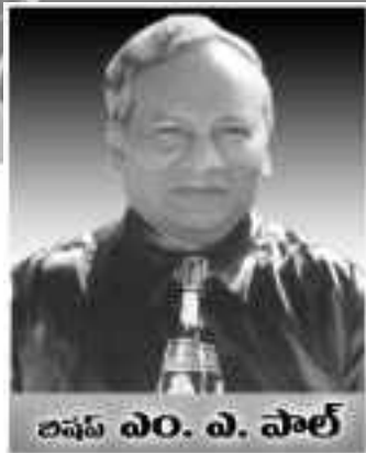
అనం. ఎ. పాల్

77వ కీర్తన 1-3 వచనాలలో “నా ఆపత్నాలమందు నేను ప్రభువును వెదకితిని, రాత్రివేళ నా చెయ్యి వెనుకకు తీయకుండా దాచబడియున్నది. నా ప్రాణము ఓదార్పు పొందనొల్లకయున్నది. దేవుని జ్ఞాపకము