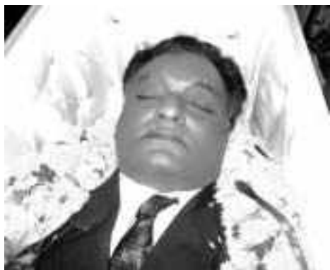
2009 లో...