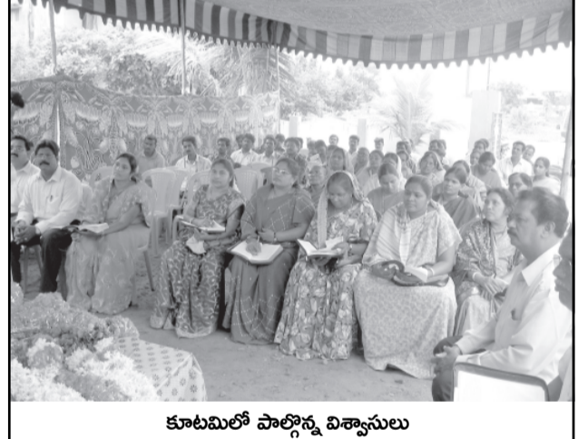
కూటమిలో పాల్గొన్న విశ్వాసులు