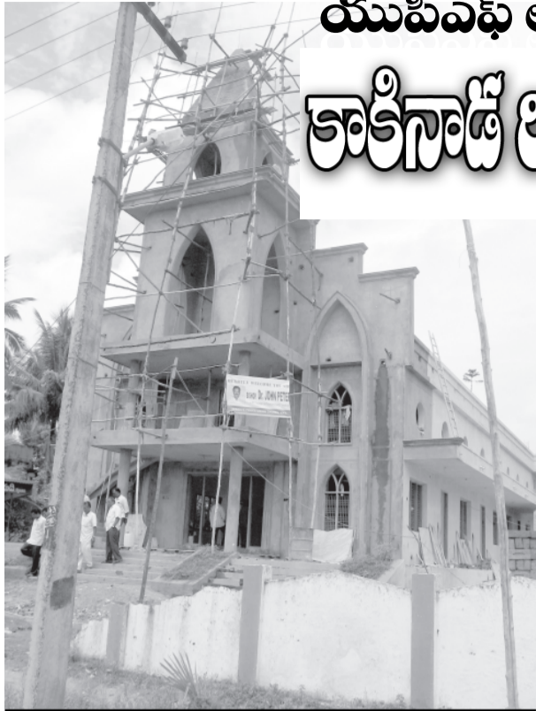
కాకినాడకే తలమానికం కాబోతుందా ఈ చర్చి... ?