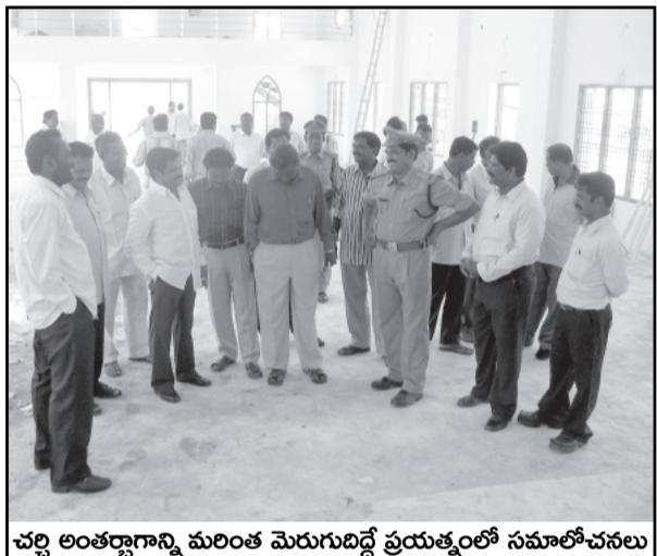
చర్చి అంతర్భాగాన్ని మరింత మెరుగుదిద్దే ప్రయత్నంలో సమాలోచనలు